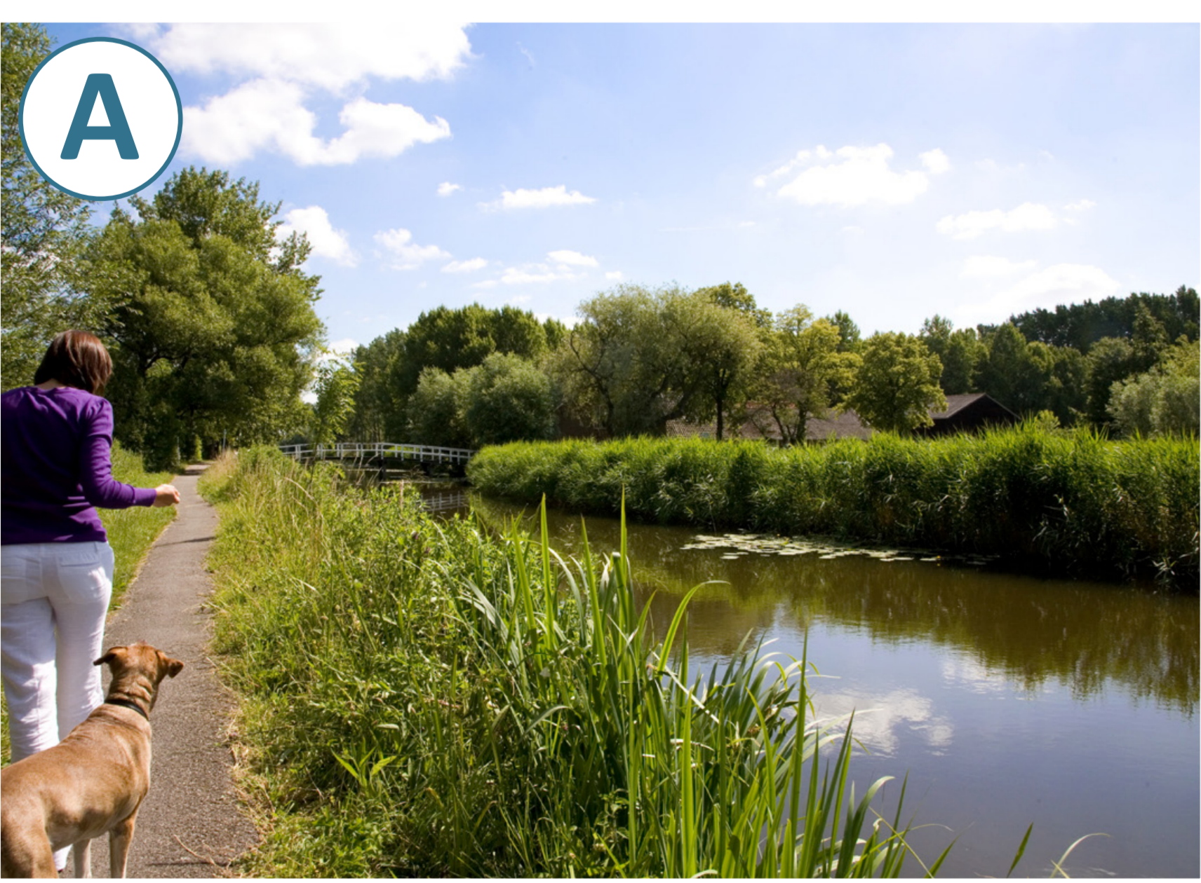
Inrichtingsvoorstel watergang langs de Kruisstraat