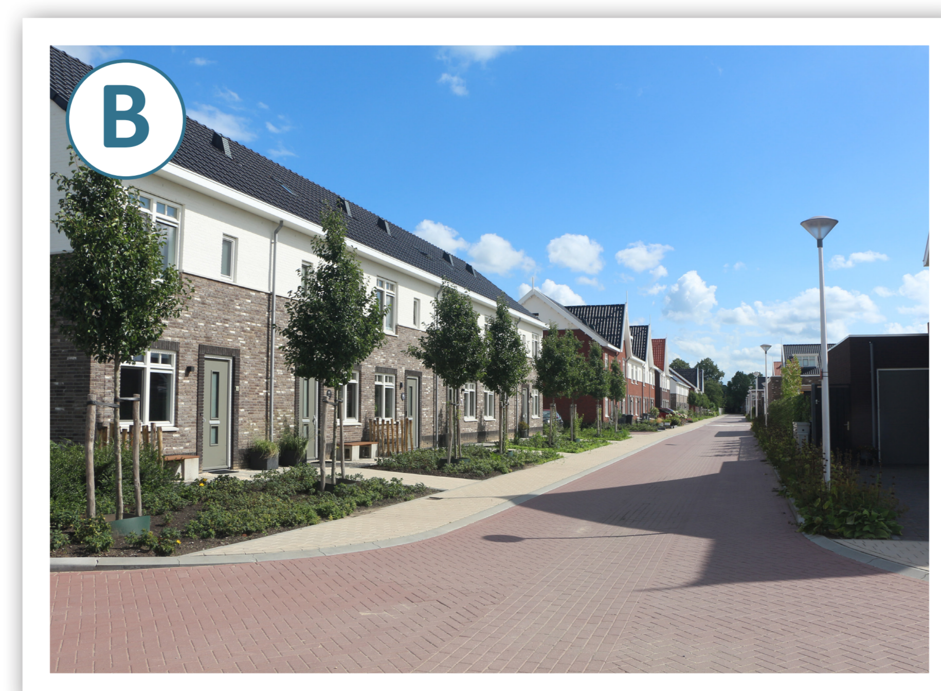
Onsluiting autoverkeer 1e fase