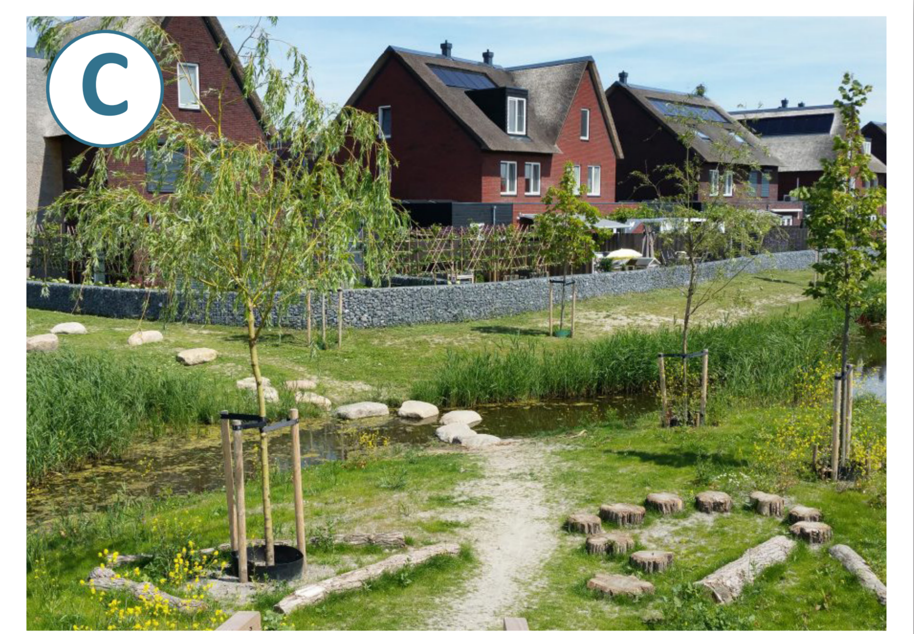
Inrichtingsvoorstel hofjes met waterberging