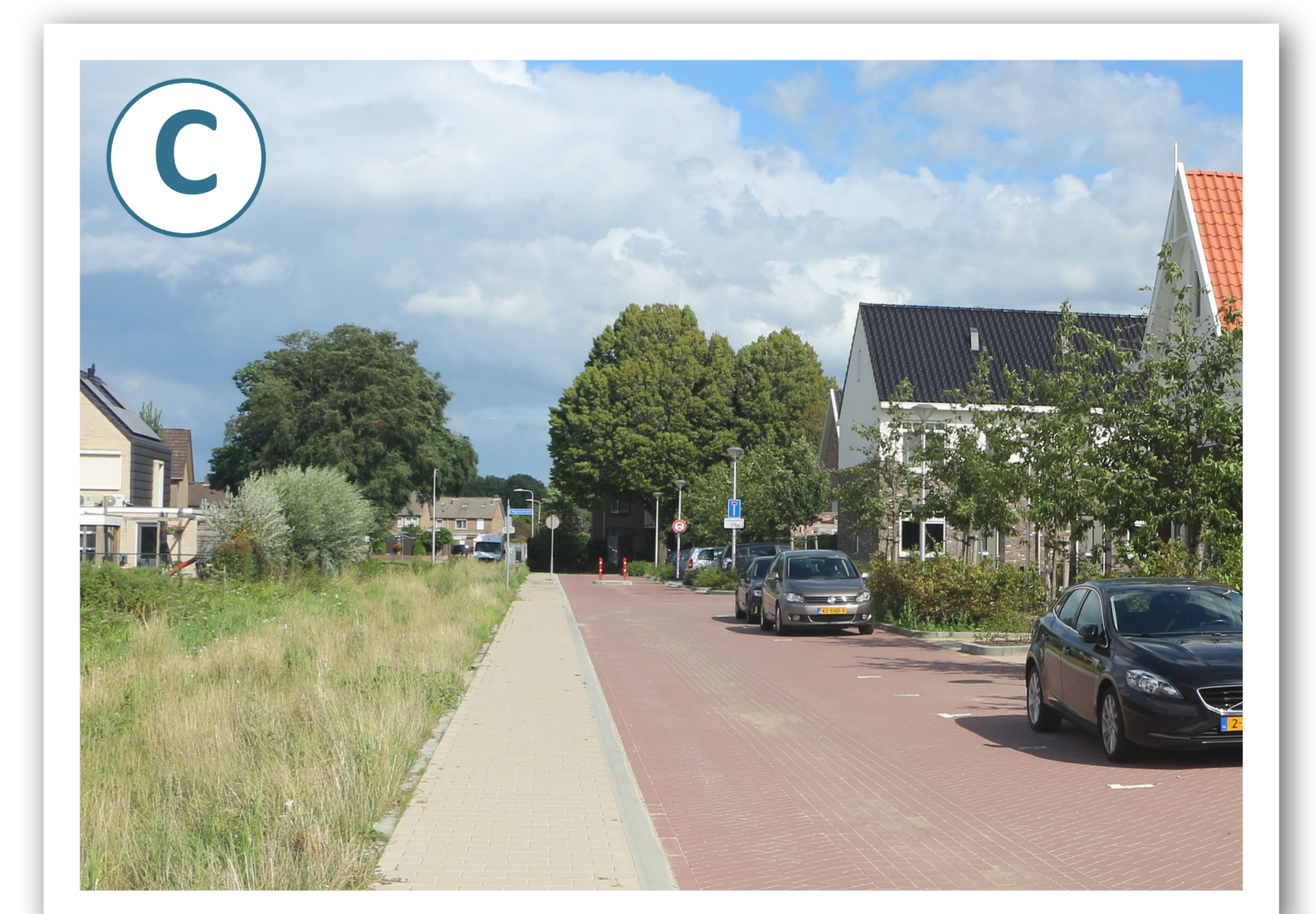
Langzaamverkeerverbinding 1e fase