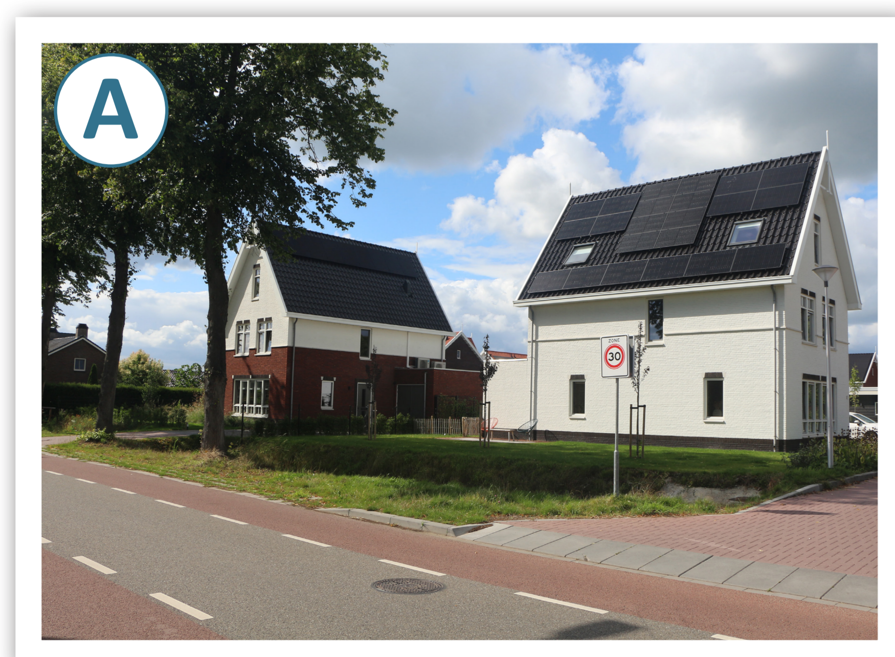
Aansluiting Nijmeegsestraat 1e fase