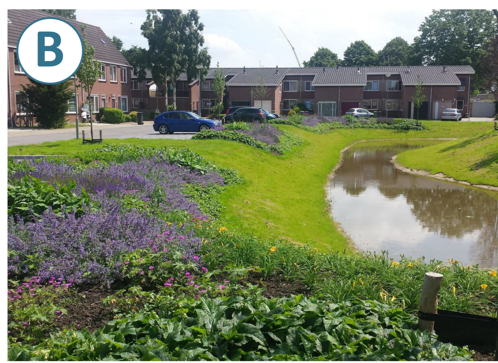
Inrichtingsvoorstel centrale waterberging